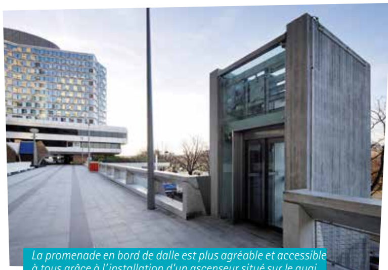
La promenade en bord de dalle est plus agréable et accessible à tous grâce à l'installation d'un ascenseur situé sur le quai André Citroën.

Avec la rénovation des aménagements, la construction de nouvelles jardinières ainsi que la réfection de l'étanchéité, les abords des tours de la dalle ont été totalement repensés sur Bérénice Ouest. La fin de ces travaux marque l'aboutissement du programme de rénovation initié en 2005. L'espace est désormais clarifié et plus agréable pour les promeneurs.