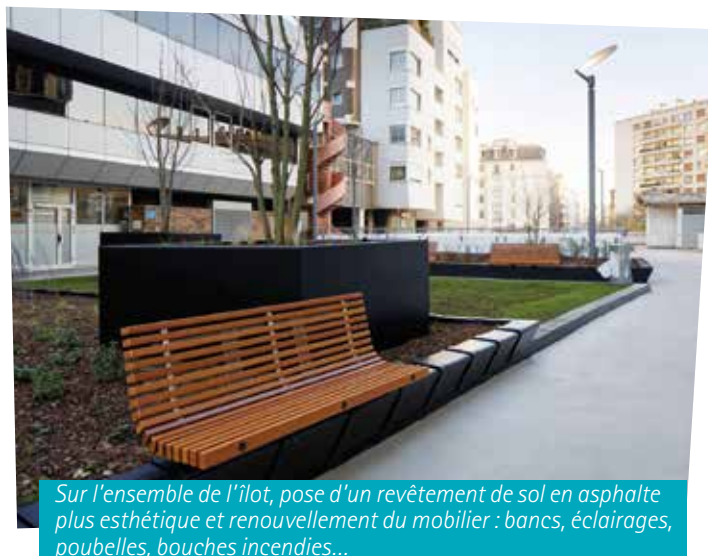
Sur l'ensemble de l'îlot, pose d'un revêtement de sol en asphalte plus esthétique et renouvellement du mobilier : bancs, éclairages, poubelles, bouches incendies...