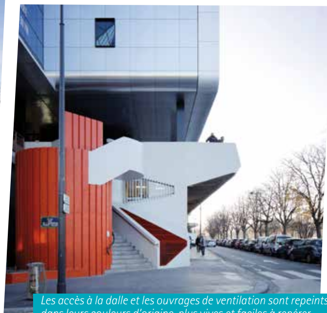
Les accès à la dalle et les ouvrages de ventilation sont repeints dans leurs couleurs d'origine, plus vives et faciles à repérer.