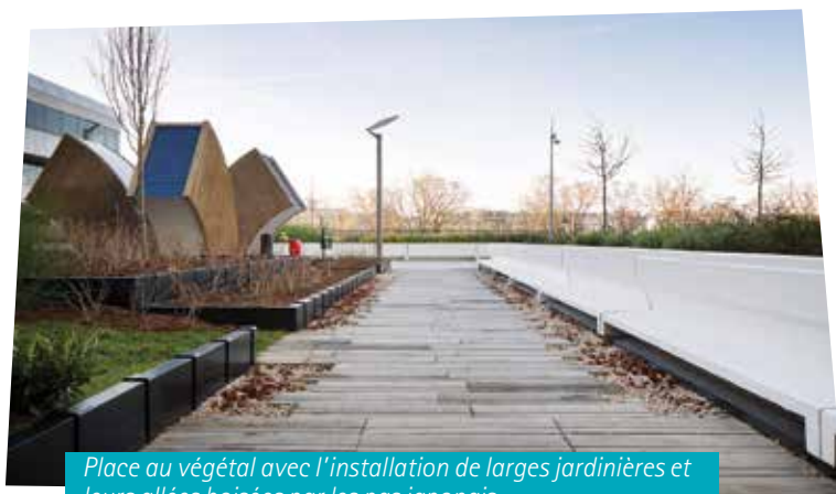
Place au végétal avec l'installation de larges jardinières et leurs allées boisées par les pas japonais.