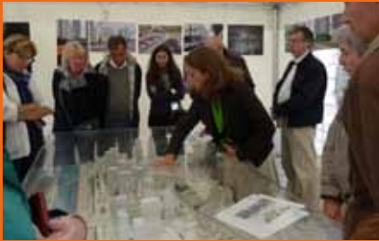
La Fête côté Seine, édition 2012.

La dalle Centaure - Verseau sera alors achevée : rendez-vous est donc donné sur la place centrale, à proximité du bassin miroir. Pour un avant-goût de ce qui vous attend, scannez le QR-code ci-dessous.