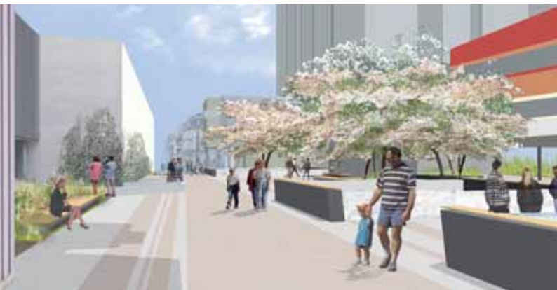
Esplanade et rive de Seine vue vers le XV ème