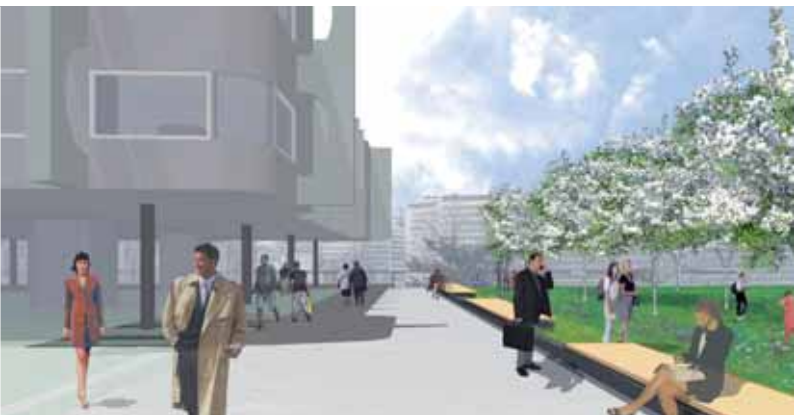
Jardin Orion (perspective vers la Seine)

Le jardin Cassiopée présentera différents étages de végétation. Bosquets de petits érables, de chênes verts persistants, d'érables champêtres, arbustes de grandes et de petites tailles (notamment sur le pourtour du jardin), grimpants aussi (majoritairement des rosiers), ainsi que vivaces et graminées en tapis, créeront une ambiance de petit parc.