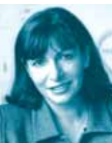
Anne Hidalgo Présidente de la Semea 15, 1 ère Adjointe au Maire de Paris, Conseillère Régionale d'Île de France

Concertation, tel est le maître mot de la démarche qui guide la Semea 15, et que nous mettons systématiquement en œuvre, quelle que soit l'opération, son lieu et sa taille. Elle permet d'enrichir la réflexion, de préciser les objectifs avec les experts et de mieux répondre aux attentes exprimées par les usagers.