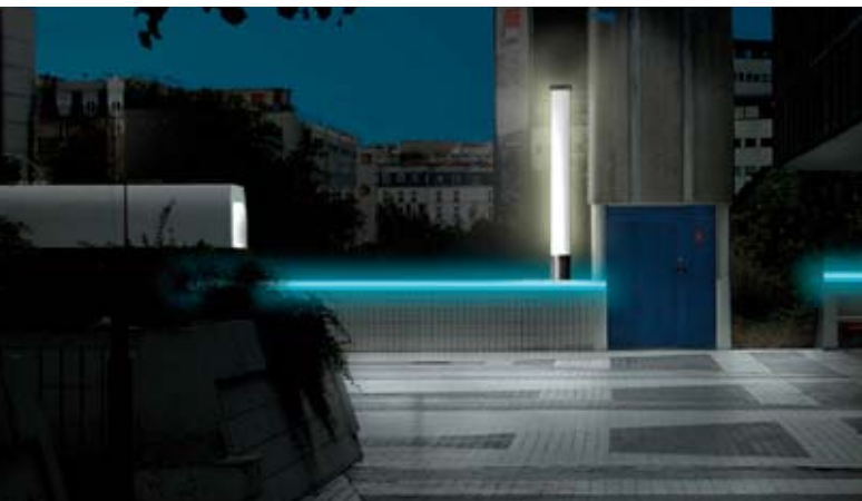
Esplanade et rive de Seine vue vers le XV ème