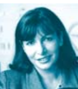
Anne Hidalgo Présidente de la Semea15, 1 ère Adjointe au Maire de Paris, Conseillère Régionale d'Ile de France

Notre quartier commence à se redessiner et ce numéro présente en détail la rénovation du secteur du Front de Seine. Bientôt les travaux pour le nouveau centre commercial vont débuter. Cette opération va aussi être l'occasion de mettre en œuvre une démarche en faveur de l'emploi et du développement économique pour notre arrondissement. Le partenariat entre la ville de Paris et la SCI Beaugrenelle s'est traduit par la signature d'une convention d'engagement pour l'emploi. Celle-ci associe les différents acteurs de l'emploi local et a pour but de favoriser l'insertion professionnelle des jeunes demandeurs d'emploi du 15 ème arrondissement et de Paris dans le cadre des recrutements du centre commercial.