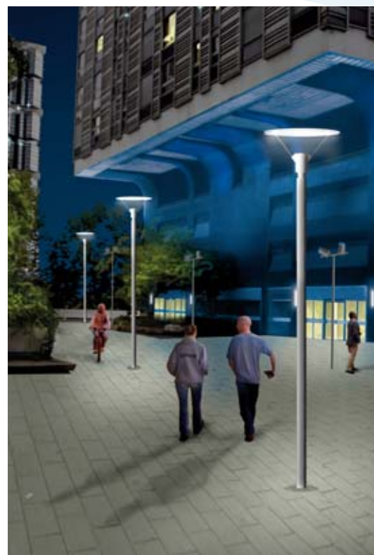
Jardin Orion (perspective vers la Seine)