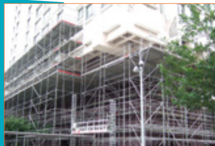
Tour Avant Seine

A partir du 1 er juillet, le nettoyage de la dalle va être renforcé par le passage d'une auto laveuse à batterie 7 heures par jour du lundi au samedi.