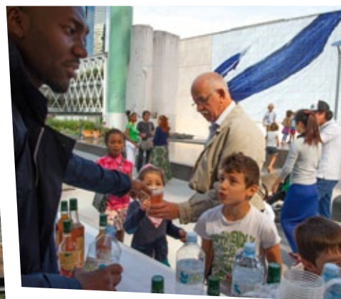
Le bar à sirops bio a ravi petits et grands

En avant pour une visite guidée ! Les trois promenades commentées (de Cassiopée-Orion, Vêga et Centaure-Verseau) ont à chaque fois réuni une quinzaine de participants